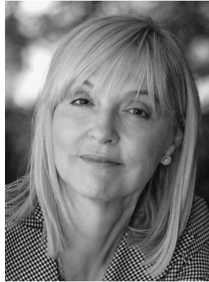
Dr. Beate Merk, MdL Bayerische Staatsministerin der Justiz und für Verbraucherschutz